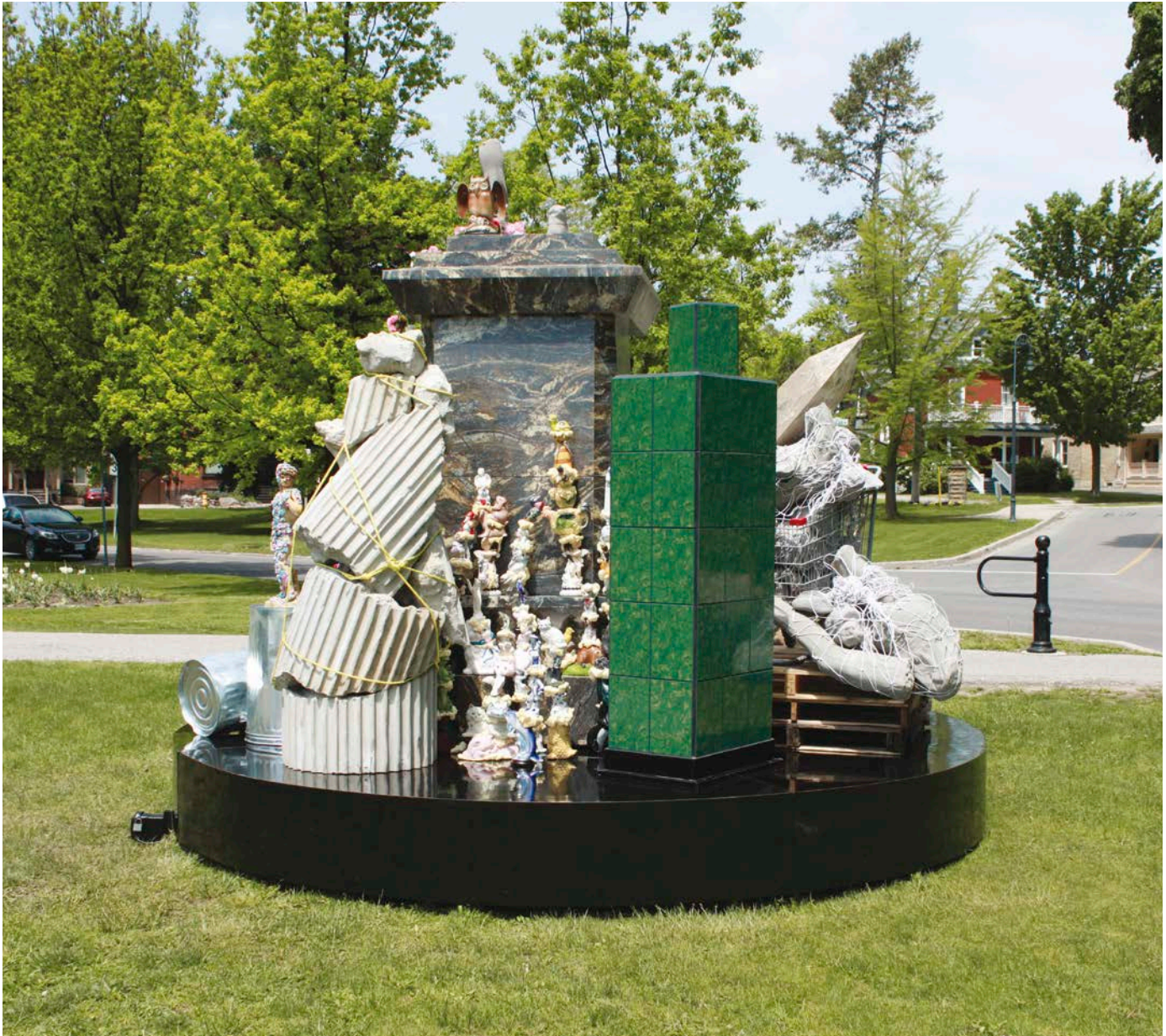
Acapulco, Monuments , 2016. CAFKA - Contemporary Art Forum Kitchener and Area, Kitchener, Ontario. Avec l'aimable permission des artistes. Photo : Acapulco.

de « monument domestique », lui accordant une place parmi les répliques bon marché des chefs-d'œuvre anciens qui trônent devant certains bungalows – ce qui constituerait en quelque sorte son ultime rédemption. Le passant attentif remarquera cependant la présence d'un sourire en peinture aérosol jaune sur la partie supérieure. Voilà qui pique la curiosité : est-ce l'œuvre de vandales ? Ce sympathique graffiti a plutôt été apposé en guise d'appât par les artistes, souhaitant ainsi susciter d'éventuels actes iconoclastes véritables.