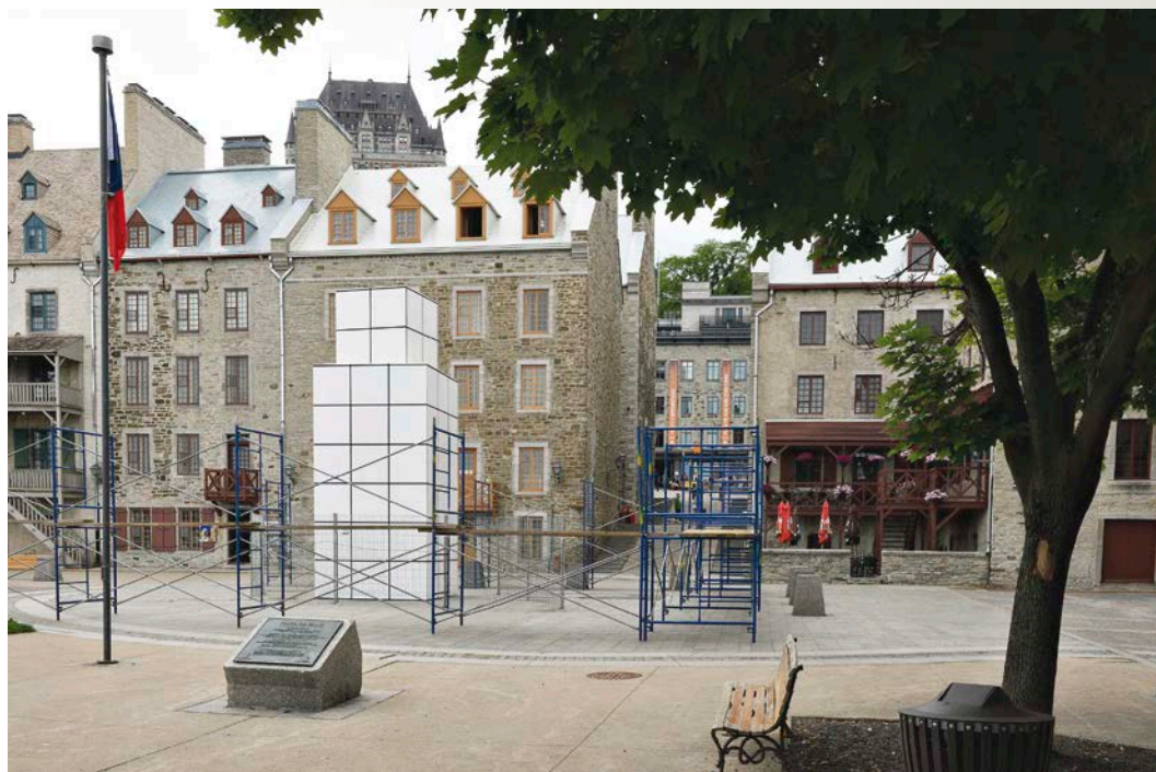
Jean Pierre Raynaud, Dialogue avec l'histoire, 1987-2015. Source : Le Soleil, 17 juin 2015.

Si l'on en juge par l'attention médiatique accordée aux polémiques touchant l'art public, ce type de création apparaît particulièrement propice à la controverse. Vandalisées, démantelées, voire transformées en objets de détestation collective, plusieurs de ces œuvres suscitent régulièrement des réactions négatives – quand elles ne sont pas tout simplement ignorées et négligées. Les cas répertoriés par Nathalie Heinich, dans son célèbre ouvrage L'art contemporain exposé aux rejets : études de cas (Éditions Jacqueline Chambon, 1998), témoignent d'ailleurs à la fois de la récurrence et de la virulence des attaques tant symboliques que physiques perpétrées à l'endroit des œuvres d'art public. Nous analyserons ici la controverse entourant Dialogue avec l'histoire (1987), sculpture réalisée par l'artiste français de réputation internationale Jean Pierre Raynaud pour la Place de Paris située dans le secteur de Place-Royale à Québec. L'œuvre, qui avait fait l'objet de vives critiques dès son inauguration, est détruite de manière spectaculaire en juin 2015 par la Ville de Québec sous prétexte qu'elle était dans un état de dégradation avancé. Cette décision a pour effet de réactiver une controverse latente, alimentée au fil des ans notamment par la publication sporadique de lettres ouvertes décriant l'aspect de la sculpture ou encore par des journalistes insistant sur son caractère prétendument inadéquat pour ce site historique.