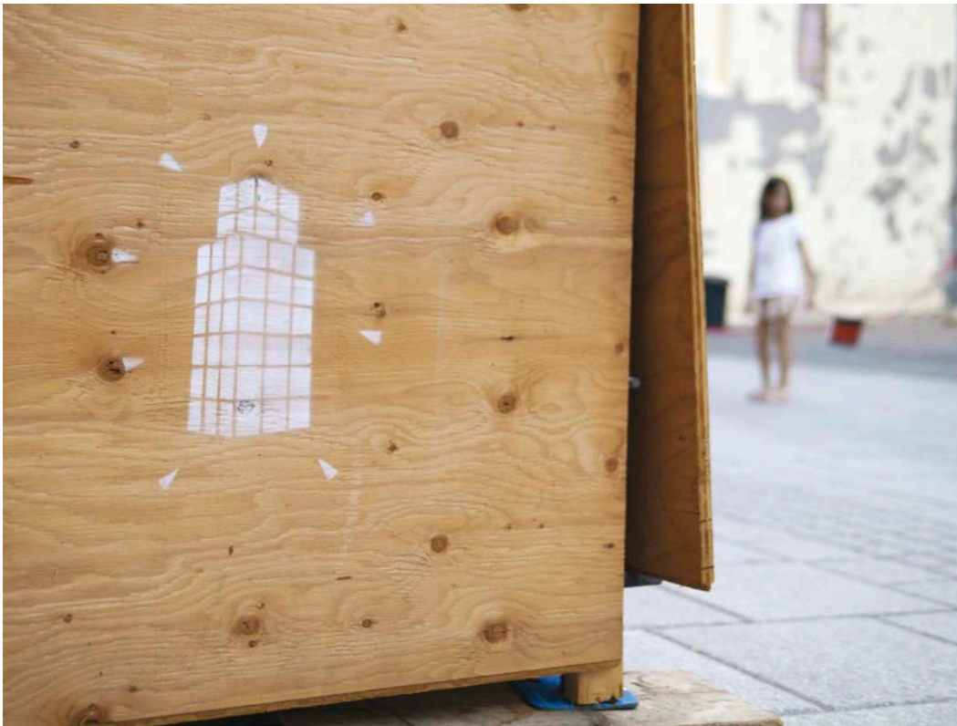
Wartin Pantois, Hommage à Jean Pierre Raynaud , 2015. Peinture aérosol, pochoir, rue Notre-Dame, Québec.

d'ailleurs accentué lors de l'inauguration de la Place de Paris, célébrée en grande pompe en présence d'une fanfare et de soldats en uniforme du régiment de Montcalm. Il semble que le dialogue historique et artistique proposé par l'artiste échappe ainsi à la majeure partie des usagers de la place. À cet égard, remarquons que le titre de l'œuvre est régulièrement escamoté au profit du sobriquet simpliste de « cube blanc », désignation qui, en plus d'être réductrice, est inexacte : la notion de dialogue entre les siècles et entre les peuples français et québécois est de cette manière évacuée.